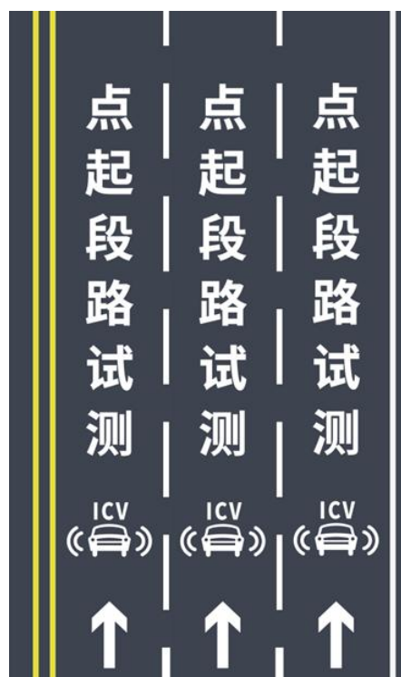
图 B.2 智能网联汽车测试路段（起点）路面标线