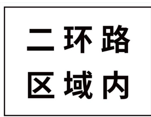
图 C.2 智能网联汽车测试区域范围辅助标志示例