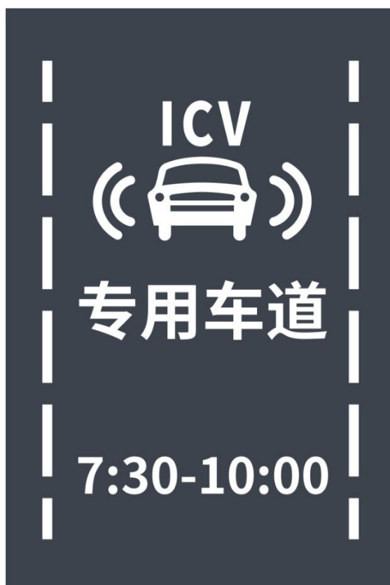
图 B. 13 智能网联汽车专用车道路面标线