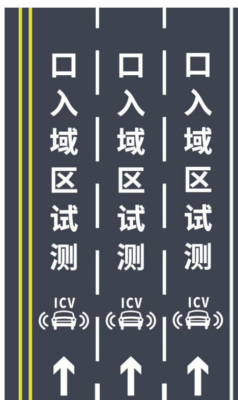
图 B.6 智能网联汽车测试区域（入口）路面标线