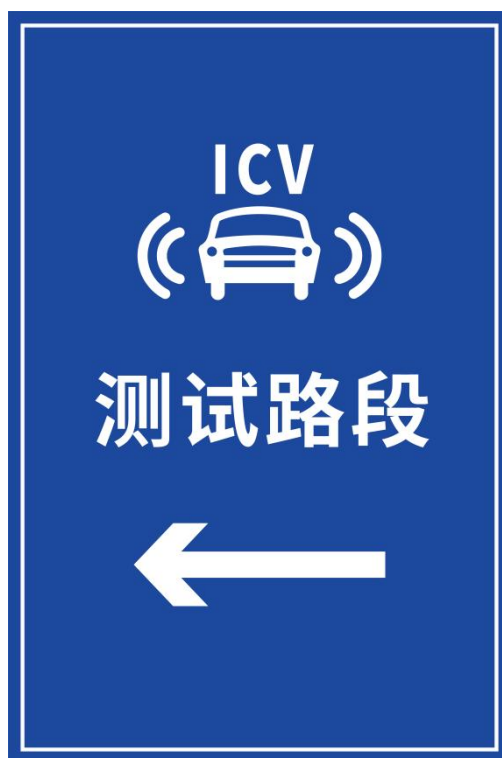
图 B.9 智能网联汽车测试路段内交叉口指示标志