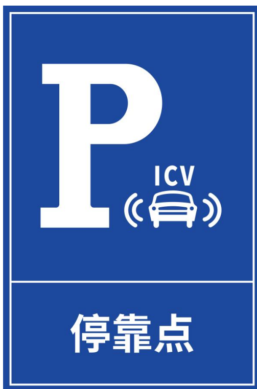
图 B.11 智能网联汽车停靠点指示标志