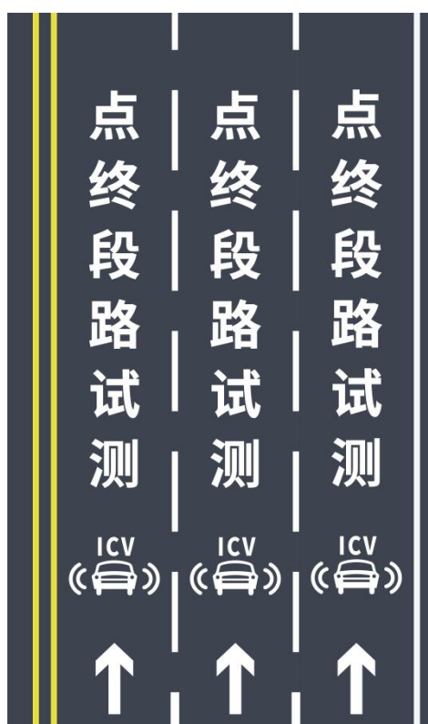
图 B.4 智能网联汽车测试路段（终点）路面标线