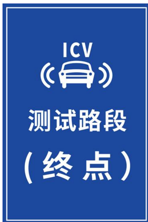
图 B.3 智能网联汽车测试路段（终点）指示标志