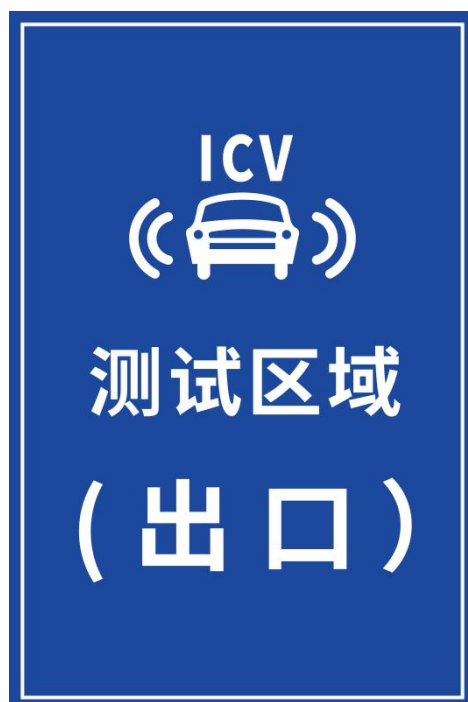
图 B.7 智能网联汽车测试区域（出口）指示标志