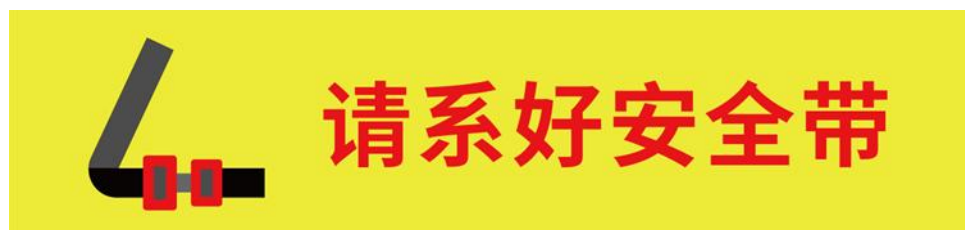
图 D.3 智能网联汽车车内安全提示信息