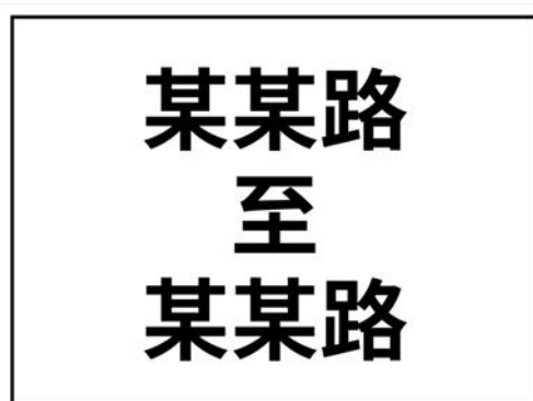
图 C.1 智能网联汽车测试路段起终点辅助标志示例