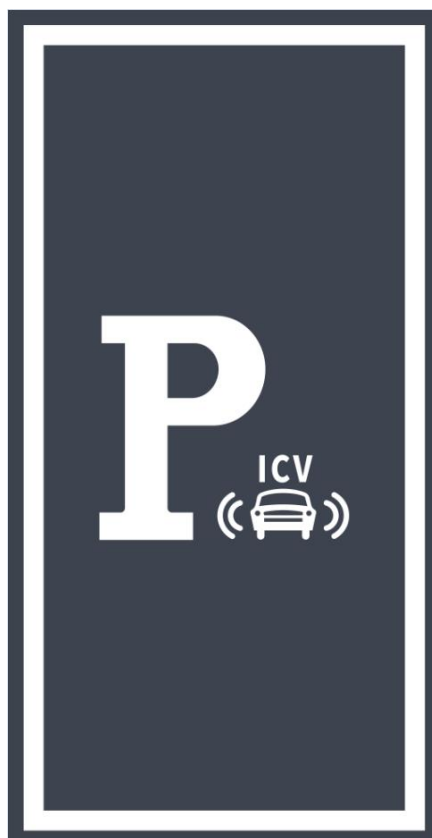
图 B.12 智能网联汽车停车位标线