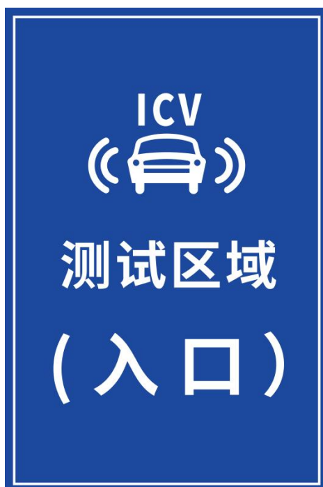
图 B.5 智能网联汽车测试区域（入口）指示标志