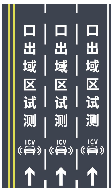
图 B.8 智能网联汽车测试区域（出口）路面标线